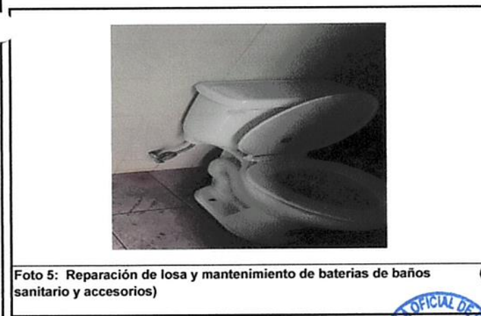
Foto 5: Reparación de losa y mantenimiento de baterías de baños sanitario y accesorios)