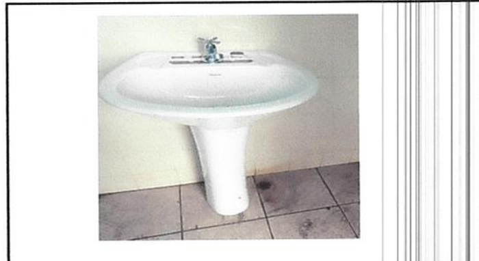
Foto 10: Sustitucion de lavamanos con sus respectivos accesorios de instalacion.