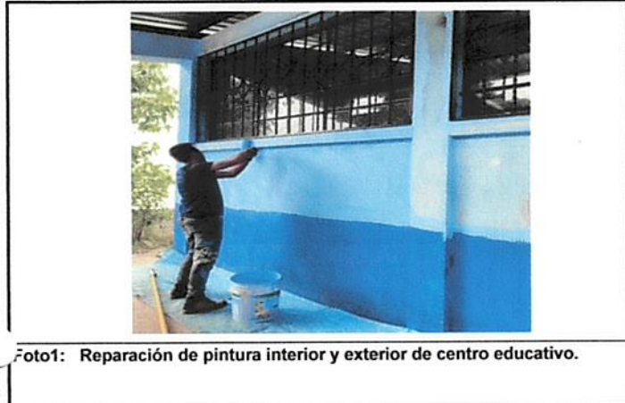
Foto1: Reparación de pintura interior y exterior de centro educativo.