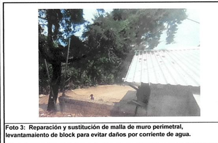
Foto 3: Reparación y sustitución de malla de muro perimetral, levantamiento de block para evitar daños por corriente de agua.