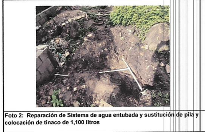
Foto 2: Reparación de Sistema de agua entubada y sustitución de pila y colocación de tinaco de 1,100 litros