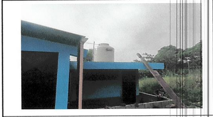
Foto 8: Instalación de protección de block alrededor de la escuela.