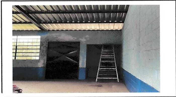
Foto7: Reparación y mantenimiento de puertas.